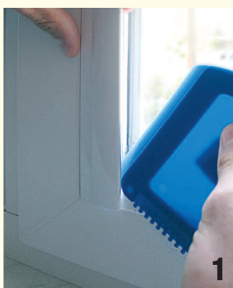
Abb. 1, 2: Nehmen Sie einen Kunststoffschaber (z.B. einen Eiskratzer o.ä.) und drücken Sie diesen gemäß der Abbildungen vorsichtig entlang der Klebeflächen. Danach entfernen Sie mit dem Kunststoffschaber die groben Klebebandrückstände. Zum Schluss sprühen Sie die restlichen Rückstände mit dem Spezialreiniger von SOLARMATIC® ein. Lassen Sie diesen einige Minuten einwirken und wischen Sie die Rückstände danach mit einem Tuch ab.