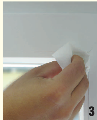
Abb. 2, 3: Mit dem Reinigungstuch die zu verklebenden Flächen am Fensterflügel säubern (seitlich und oben die Glasleistendeckflächen)