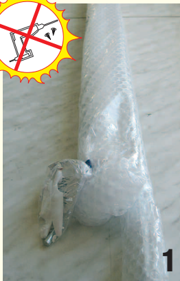
Abb. 1: Rollohalbkassette und Abdeckleisten auspacken