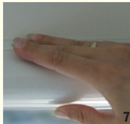
Abb. 7: Rollohalbkassette im oberen Kleberebereich über die gesamte Breite fest andrücken