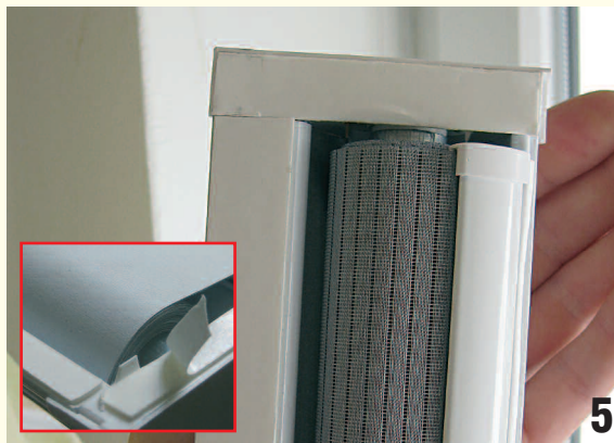
Abb. 4, 5: An der Halbkassette (rückseitig) die Folie vom Klebeband abziehen.