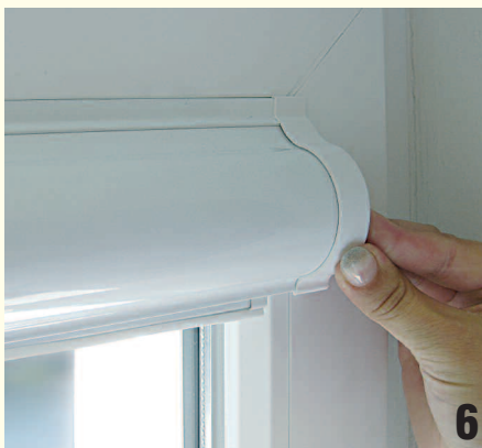
Abb. 6: Kassette vorsichtig andrücken und waagrecht ausrichten.