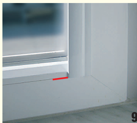
Abb. 8, 9: linkes und rechtes Abdeckprofil (ausgestanzte Seite ist oben) vorsichtig unter die Kassette bündig anschieben bis untere Höhe ( Abb. 9 ) erreicht ist. Nun die Abdeckleiste fest andrücken.